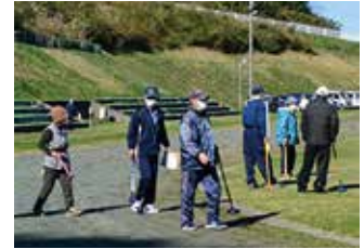
さあ、次のコースへ