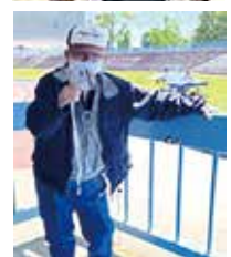
メダル取れました!