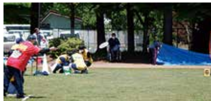
的に狙いを集中して・・・それ!!