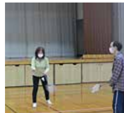
サーブします。それ!!