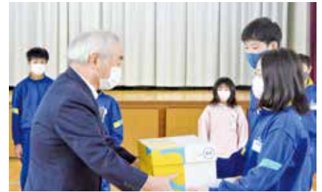
募金伝達式（普代小学校）