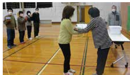
第1位おめでとうございます。